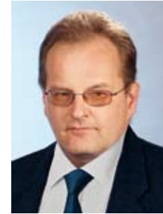
©/KK Mag.jur. Gerhard Schnögl Jurist ÖHGB Steiermark

Österreichischer Haus- und Grundbesitzerbund Landesverband Steiermark