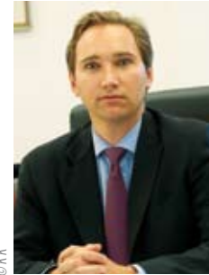
RA Dr. Alexander Klein, LL.M. Obmann ÖHGB Steiermark